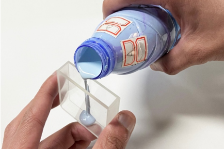
1、将测量粘稠状样品导入比色皿中。