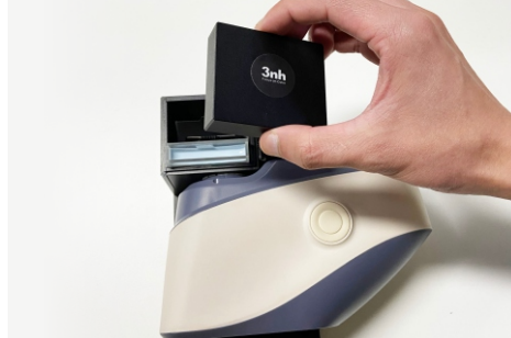
2、将比色皿安装在测试组件上